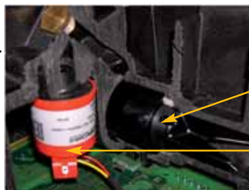
Capteur de débit