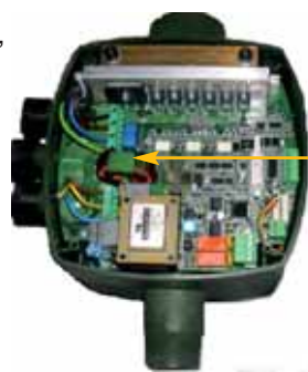
Convertisseur de fréquence