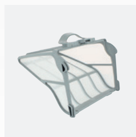
Bac filtrant Filtre très fin rigide de grande capacité (5 litres)